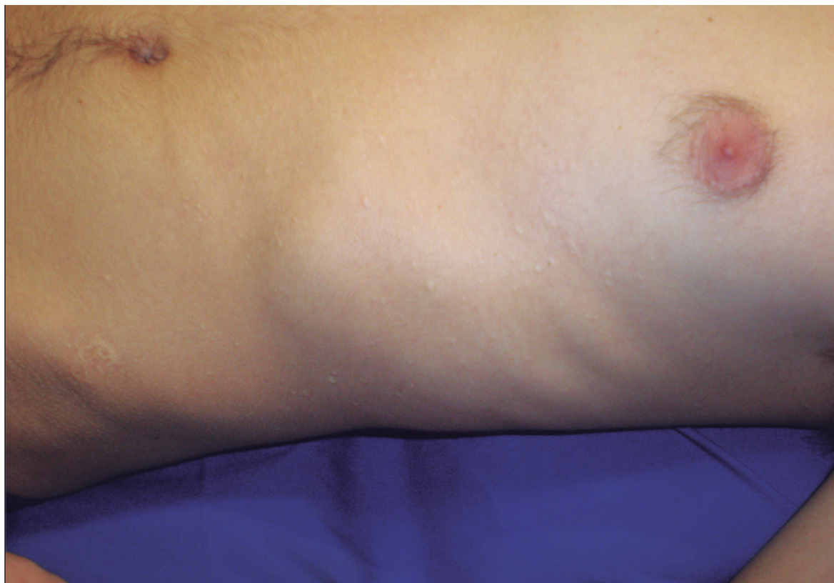
FIGURA 1. Pápulas hipocrómicas o normocrómicas en el tronco