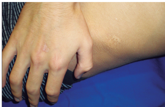
FIGURA 2. Se observan algunas lesiones de mayor tamaño en la mano y en la cadera izquierda.