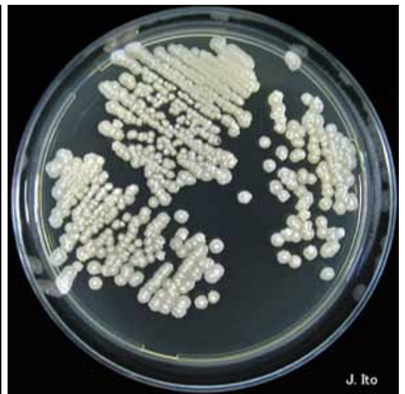
FIGURA 4. Crecimiento en agar Sabouraud con glucosa; imagen de las colonias fúngicas.