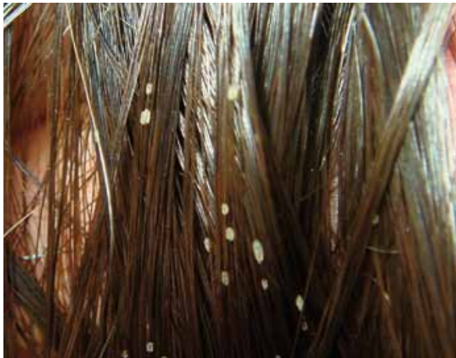
FIGURA 1. Hallazgos macroscópicos de nódulos blanquecinos en pelos del cuero cabelludo.